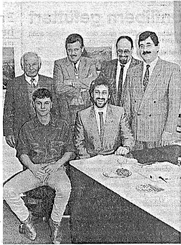
Gestern eröffnet: Die neuen Büros und das Team der «Mobiliar».